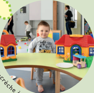
Micro-crèche à Attigny