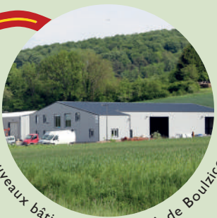
Nouveaux bâtiments sur la ZA de Boulzicourt