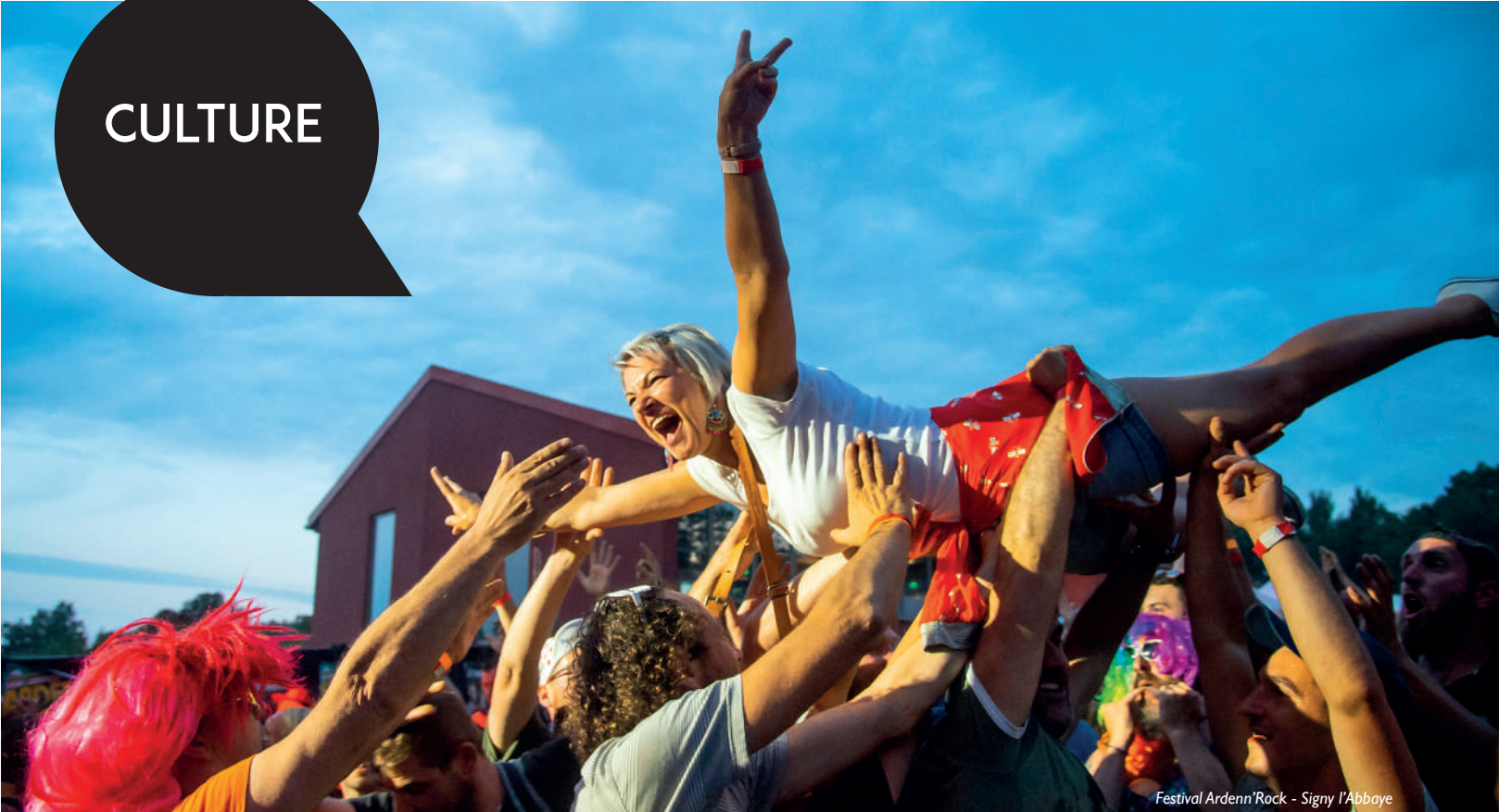
Festival Ardenn'Rock - Signy l'Abbaye