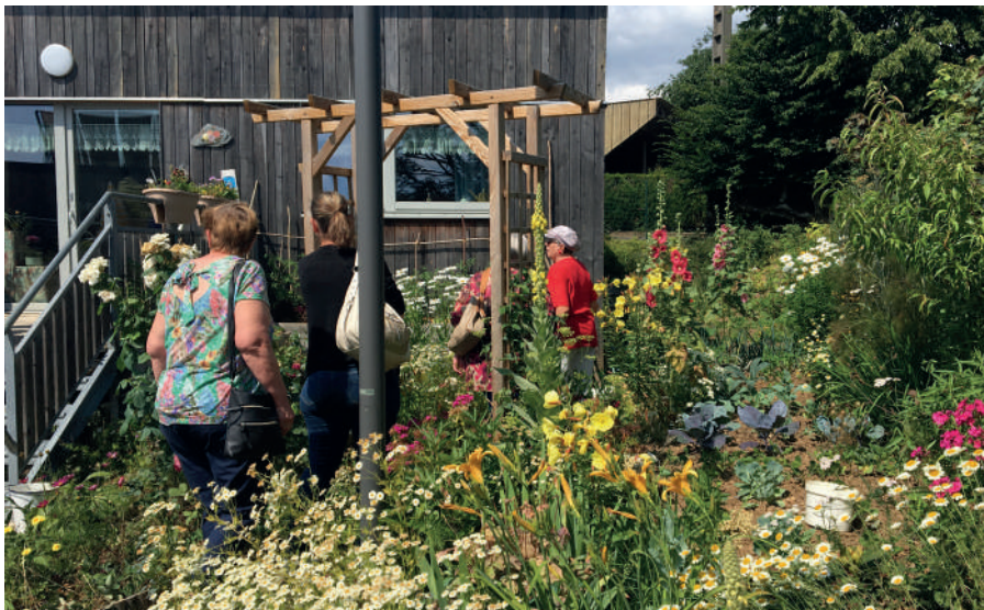
Pour mieux appréhender le projet, les habitants ont été visités le béguinage du pré fleuri, à Maubert-Fontaine.