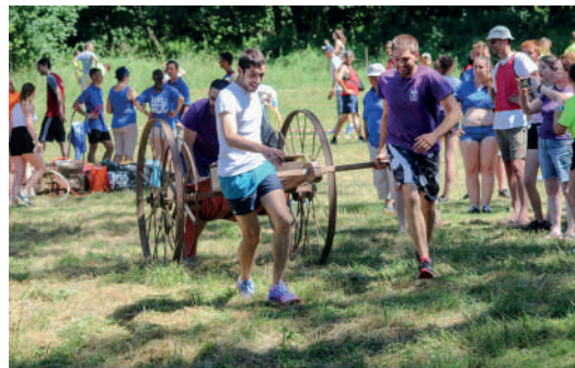
Epreuve de force et d'agilité aux jeux intervillages.