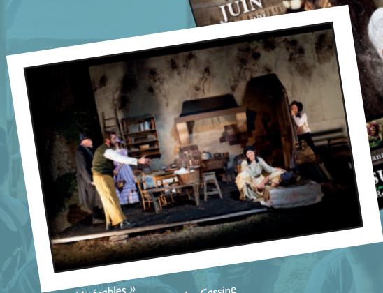
« Les Misérables » Spectacle son & lumière de La Cassine