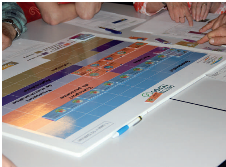
Les ateliers participatifs mis en place sont ludiques et constructifs. Une vingtaine de personnes ont participé à chacun d'eux.

Habitat et bâtiment performant, mobilité et transport, économie et développement local, consommation, alimentation, agriculture ; ressources naturelles et biodiversité : ces différentes thématiques ont été abordées dans le cadre de tables rondes où chacun a pu apporter ses idées. Un moment d'échanges convivial, puisque ces ateliers étaient accompagnés d'un buffet dînatoire. Validé en décembre par la Communauté de Communes, le plan d'action sera ensuite soumis aux autorités étatiques.