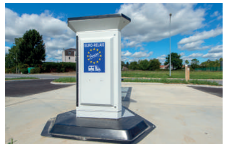
L'aire de camping-car est en fonction depuis le 16 septembre 2019.