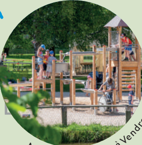
Nouveau jeu d'eau à Vendresse