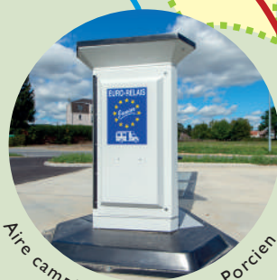
Aire camping-car à Novion-Porcien