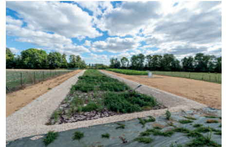
Mise en service en juin 2019, la station d'épuration par lagunage bénéficie d'une surveillance régulière.

Au cœur du village, les Crêtes Préardennaises ont aussi créé un pôle artisanal de 300 m 2 sur le site de l'ancienne caserne de pompiers. Une boulangerie y est tenue par Philippe et Aurélie Serre, qui assurent également le relais de l'agence postale. Courant 2020, des infirmières emménageront dans une des cellules. Le local restant est adapté à une activité commerciale alimentaire. Il dispose d'un laboratoire avec cuisine et chambre froide.