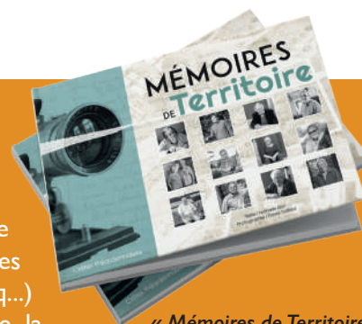
« Mémoires de Territoire » Format 16,5x24cm - 96 pages 22€

A vendre à l'Office d'Animation des Crêtes Préardennaises à Launois-sur-Vence - ☎ 03 24 35 34 33