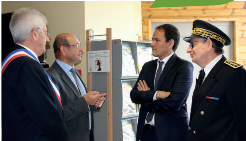
Le secrétaire d'Etat chargé du numérique a commencé sa visite à Signy-l'Abbaye.

Le jeudi 12 juin 2019, le secrétaire d'Etat chargé du Numérique, Cédric O s'est rendu à la maison de services au public (MSAP) de Signy-l'Abbaye, « afin de rencontrer des usagers des services publics en ligne pour constater sur le terrain les avancées et envoyer les améliorations à rapidement mettre en place », a-t-il déclaré.