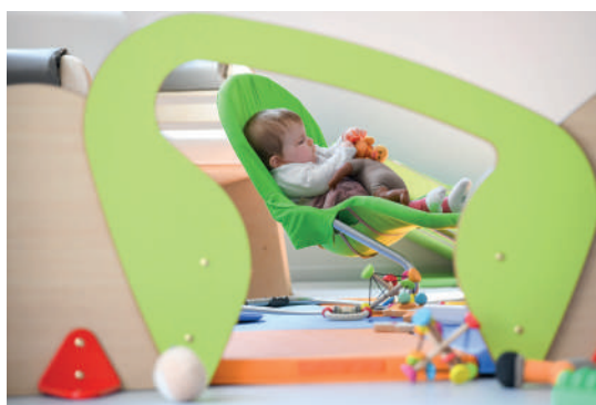
La micro-crèche accueillante à l'intérieur...