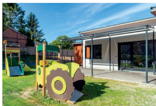
... comme à l'extérieur.