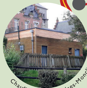
Chaufferie bois à Saulces-Monclin