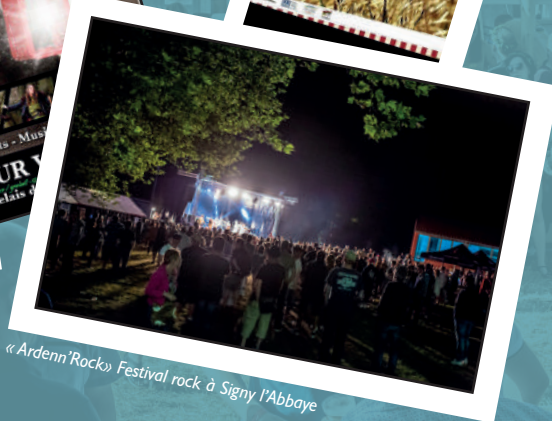
« Ardenn'Rock » Festival rock à Signy l'Abbaye