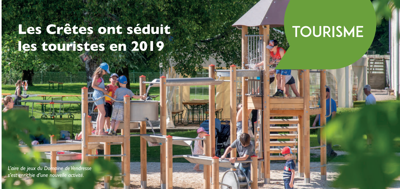
L'aire de jeux du Domaine de Vendresse s'est enrichie d'une nouvelle activité.

E n quête de nature, d'émotion et de culture, les touristes et vacanciers ont trouvé un terrain de jeux idéal au sein des Crêtes Préardennaises cet été.