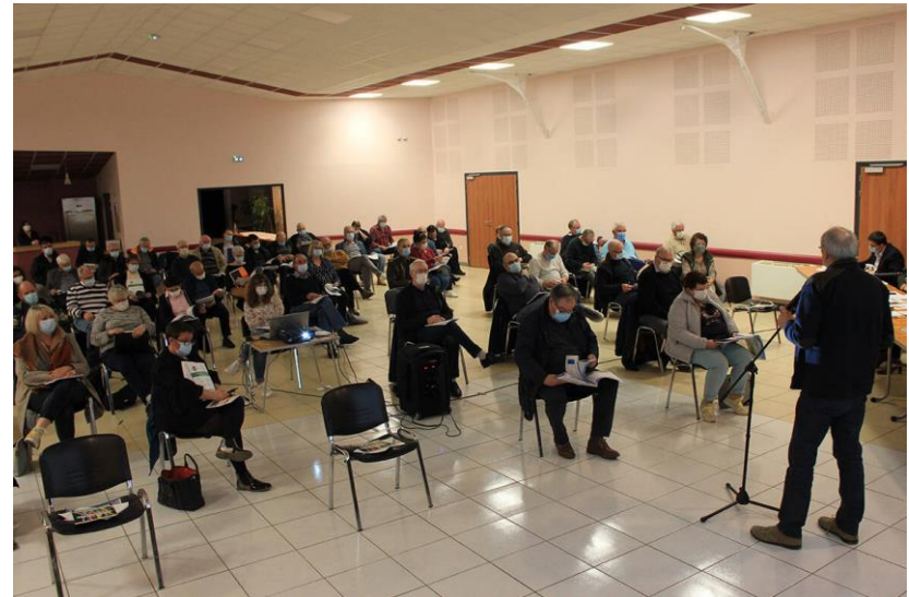
Conseil de Communauté du 30 mars à Boulzicourt