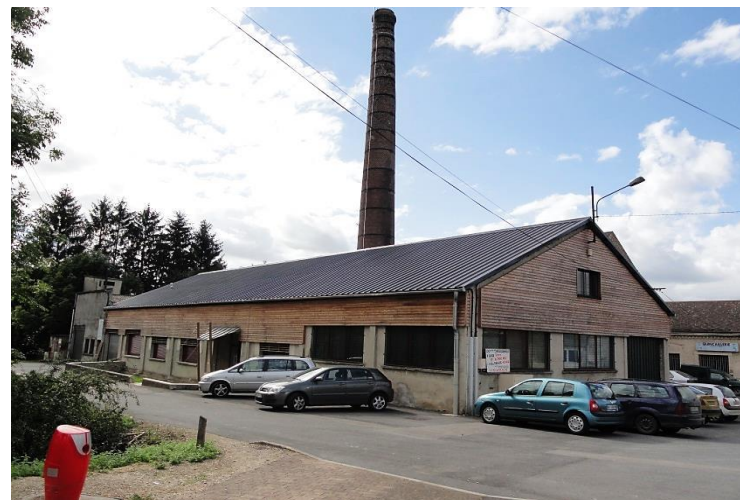
Pôle d'entreprises de Signy-L'Abbaye