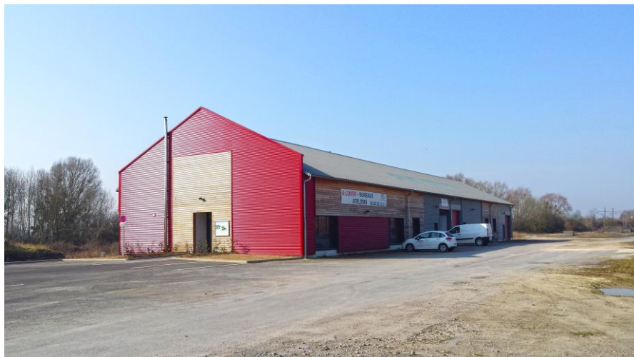
Pôle d'entreprises de Lucquy

11 LOCAUX INOCCUPÉS (surtout les bureaux) sur 39 ( taux remplissage 72 % )