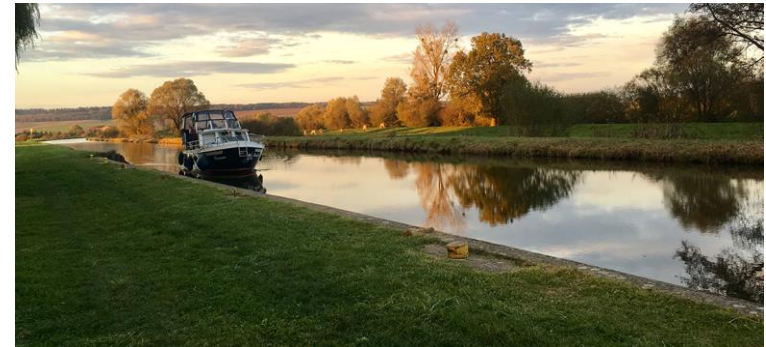
Aménagement future Voie Verte Sud Ardennes