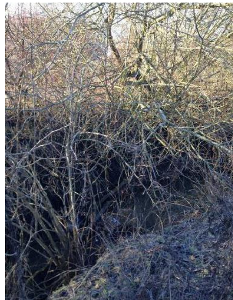
Végétation recouvrant fortement le ruisseau