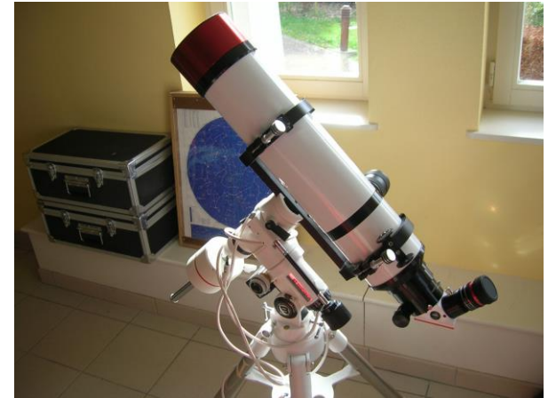
Acquisition lunette solaire – Club Astro.