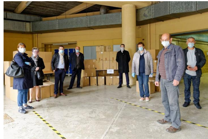
Opération 1 masque par Ardennais