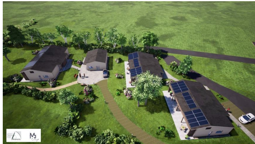
Béguinage de poix terron (ecoquartier)