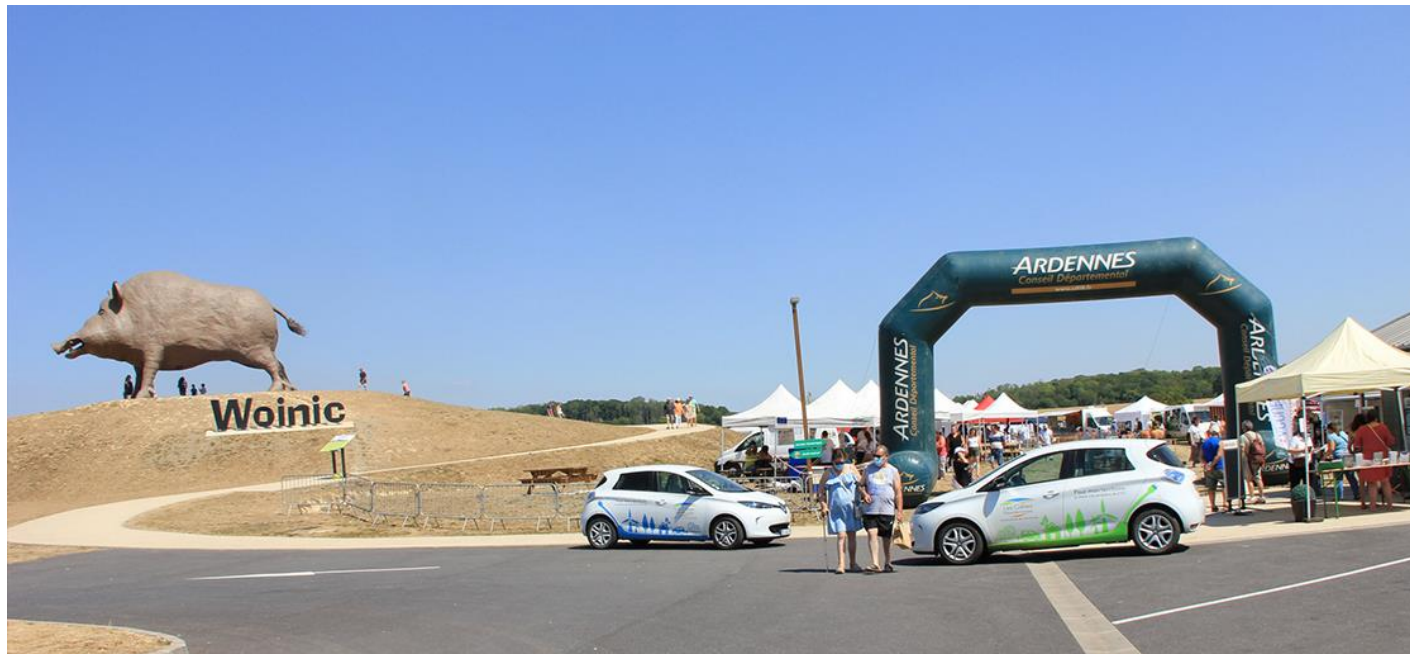
Estivales des Crêtes le 08/08 à Woinic

Organisation des Estivales le 08/08 à WOINIC.