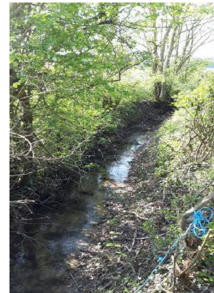
Maintien d'un aspect voûte de la végétation