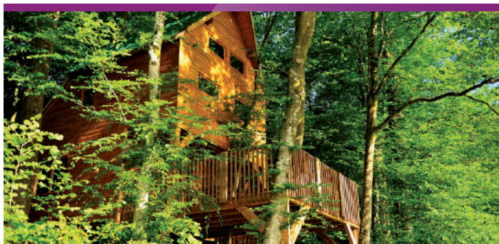
Cabanes Perchées - Signy l'Abbaye