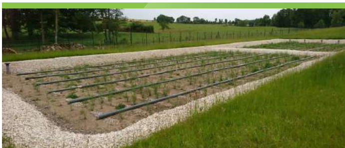
Filtres plantés N-1

Il s'agit de la méthode la plus respectueuse de l'environnement.