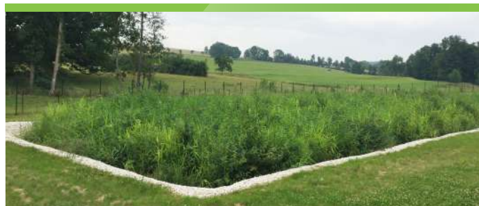
Filtres plantés N