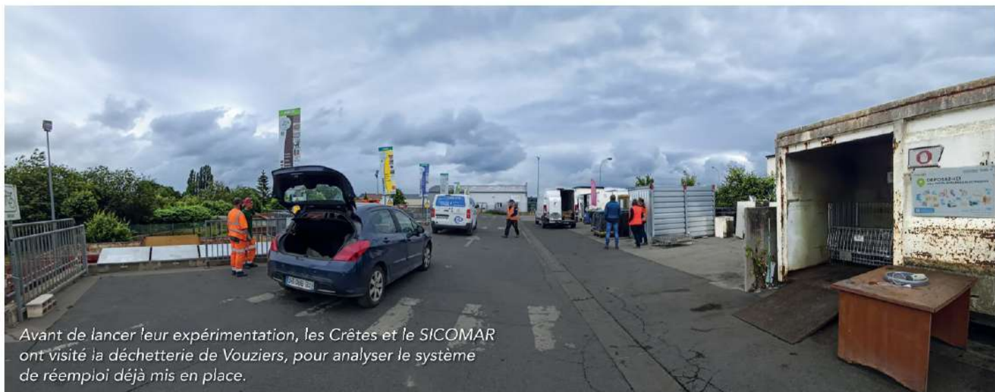
Avant de lancer leur expérimentation, les Crêtes et le SICOMAR ont visité la déchetterie de Vouziers, pour analyser le système de réemploi déjà mis en place.