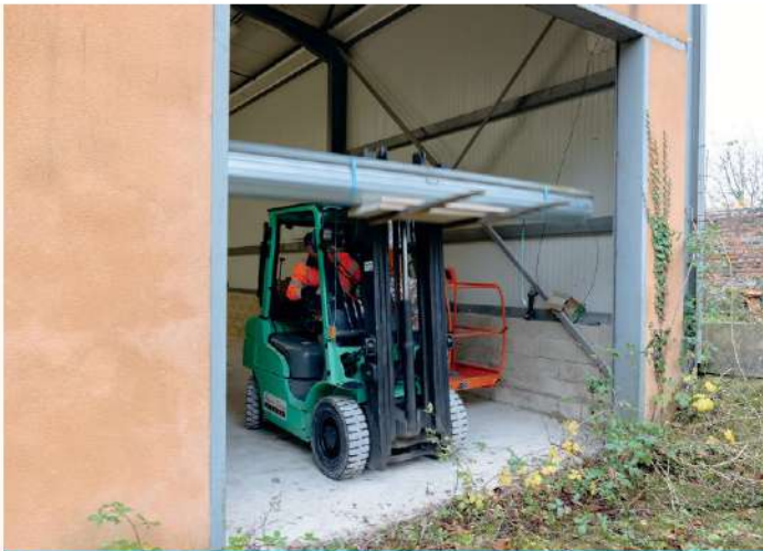
Après avoir été soigneusement démonté, le rideau métallique sera réemployé sur un autre chantier.

besoins sur le secteur. Proche de l'échangeur autoroutier, le bourg de Novion est pourtant dynamique, et l'emplacement du pôle artisanal intéressant. S'appuyant sur différentes demandes recensées en 2025, la collectivité a donc décidé de transformer le bâtiment en espaces de bureaux avec points d'eau, espaces