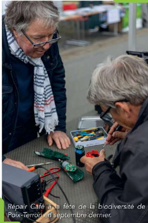
Repair Café à la fête de la biodiversité de Poix-Terron en septembre dernier.

Fort de ce constat, la Communauté de Communes des Crêtes Préardennaises s'est emparée du sujet. Dans le cadre de sa nouvelle politique d'économie circulaire, la collectivité a mis en place un partenariat avec deux associations afin de lancer un Repair Café. Vous avez des questions sur ce nouveau service ? Voici les réponses.